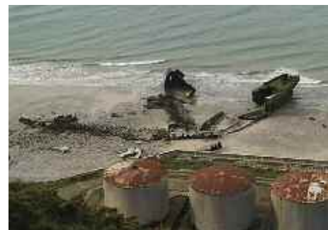
Zusterschepen van Le Serpent op het strand in Le Havre

STICHTING Het afzinken is een project waar de NOB via de speciaal hiervoor in het leven geroepen Stichting Zeeuwse Duikwrakken sindsdien nadrukkelijk bij is betrokken, samen met Rijkswaterstaat Zeeland, Provincie Zeeland, Gemeente Schouwen-Duiveland, Natuur- en Recreatieschap De Grevelingen en Dive-Inn De Kabbelaar. Projectleider is Gerius van Woudenberg van Rijkswaterstaat Zeeland. De kosten van het gehele project bedragen circa 300.000 euro.